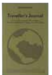
TRAVELLER'S JOURNAL — Moleskine

Ako volite psihološke trilere, ovo je pravi roman za vas. Kroz priču o otmicu dvaju djevojčica upoznajemo stanovnike izoliranog španjolskog sela, proživljavamo njihove emocije, dvojbe i tajne koje pokušavaju zadržati za sebe. Dobro pisan, napet i filmičan, roman Planina straha pružit će vam sate odlične književne razonode.