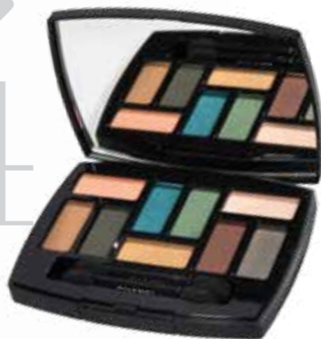
DOUGLAS PARFUMERIJA CHANEL LES 9 OMBERS PALETA SJENILA 689 KN