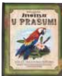
ŽIVOTINJE U PRAŠUMI — Nancy Honovich

Povijest izuma prijevoznih sredstava ispričana je kroz zanimljive ilustracije koje će privući djecu interaktivnošću i uzbuđljivošću. Istražite izume vlaka, automobila i zrakoplova, a putem riješite i misteriju profesorovog nestanka.