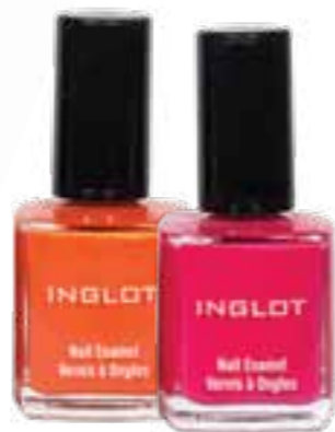
INGLOT LAK ZA NOKTE 69,00 KN