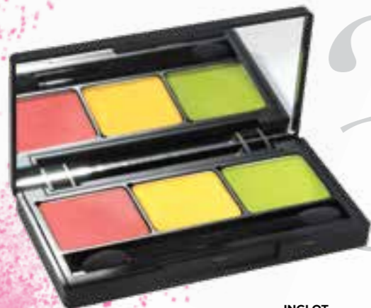
INGLOT PRAZNA KUTIJICA ZA SJENILA 53,00 KN / SJENILO ZA OČI 46,00 KN

Dodajte boje svojoj ljepoti, uronite u bogate teksture i nijanse.