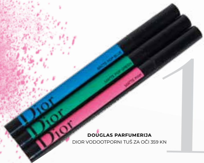
DOUGLAS PARFUMERIJA DIOR VODOOTPORNI TUŠ ZA OČI 359 KN