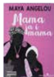
MAMA I JA I MAMA — Maya Angelou

Omiljena američka pjesnikinja, borkinja za ljudska, ženska i crnačka prava u ovoj autobiografiji priča dirljivu i snažnu priču o ljubavi. O majki i baki koje su joj pružile temelj i oslonac i pomogle joj da uspije u svijetu koji ženi i crnkinji nije bio niti malo naklonjen. Oda ljubavi i važnosti obiteljske povezanosti.