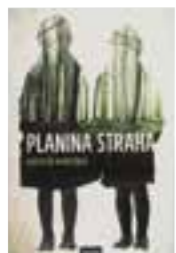
PLANINA STRAHA — Agustín Martínez

Omiljena američka pjesnikinja, borkinja za ljudska, ženska i crnačka prava u ovoj autobiografiji priča dirljivu i snažnu priču o ljubavi. O majki i baki koje su joj pružile temelj i oslonac i pomogle joj da uspije u svijetu koji ženi i crnkinji nije bio niti malo naklonjen. Oda ljubavi i važnosti obiteljske povezanosti.