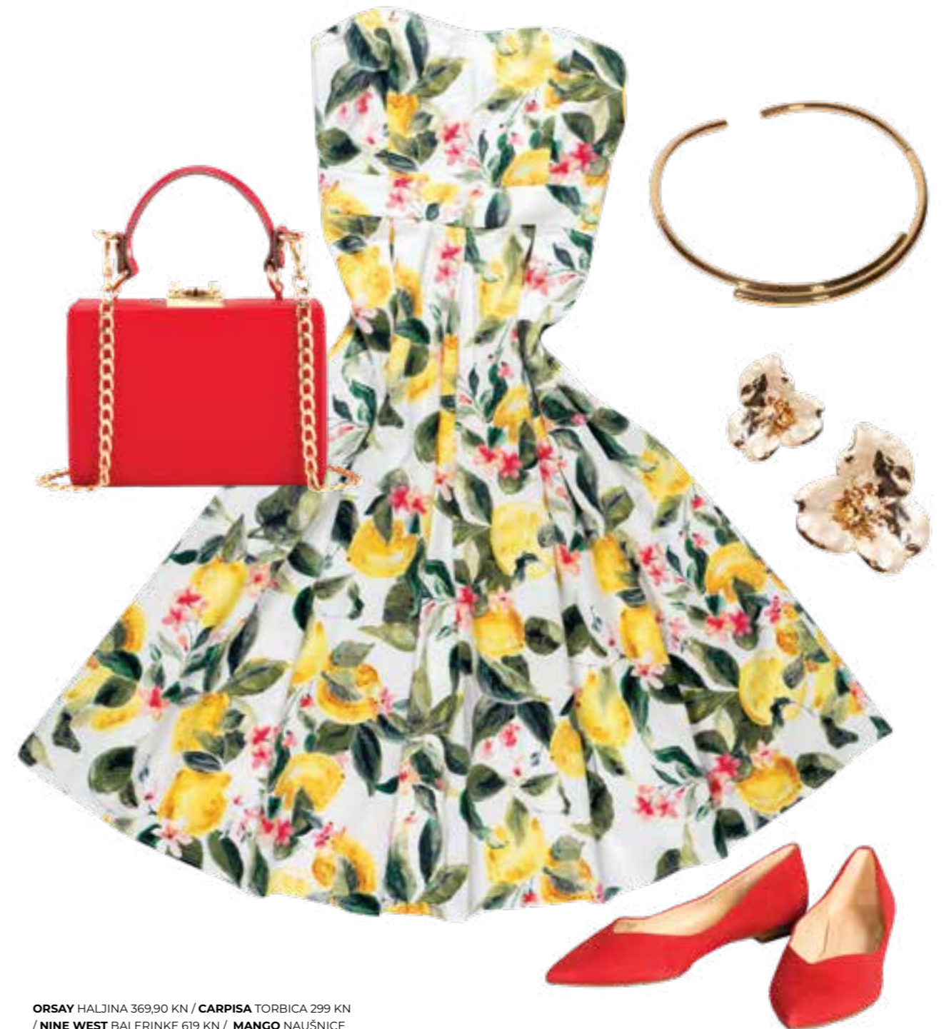
ORSAY HALJINA 369,90 KN / CARPISA TORBICA 299 KN / NINE WEST BALERINKE 619 KN / MANGO NAUŠNICE 99,90 KN / KRONA OGRLICA 1.240,00 KN

Razigrani uzorci na proljetnim i ljetnim komadima uvijek su idealan odabir!