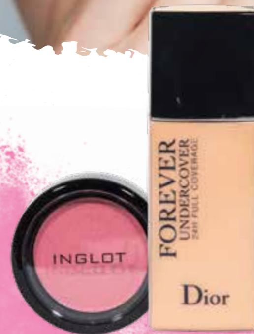
INGLOT RUMENILO 95,90 KN DOUGLAS PARFUMERIJA DIOR PUDER 359 KN

Tijekom toplih dana koža treba disati, savjetujemo da koristite lagani make up. Obratite pozornost na hidrataciju kože i odaberite lagane pudere sa zaštitnim faktorom te rumenila nježnijih tonova!