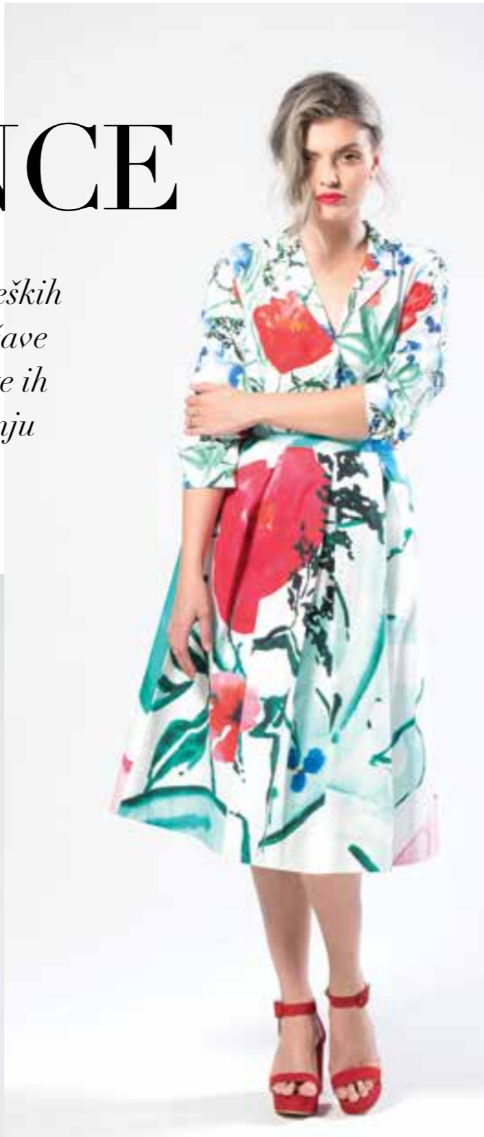
GANT SUKNJA 1.945 KN / GANT KOŠULJA 1.055 KN / CARPISA TORBICA 229 KN / SHOE BOX CIPELE 799,90 KN